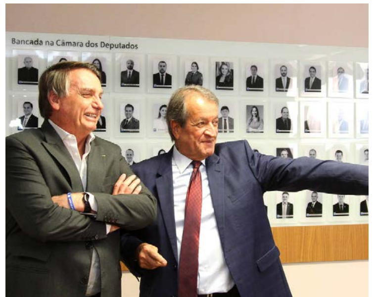
Jair Bolsonaro e Valdemar Costa Neto: conversa para superar crise no PL

Segundos relatos, o ex-presidente e o dirigente do PL conversaram sobre o episódio no final de semana. Pessoas próximas dizem que o ex-chefe do Executivo demonstrou irritação e que Valdemar se justificou, sob a alegação de que o vídeo foi editado.