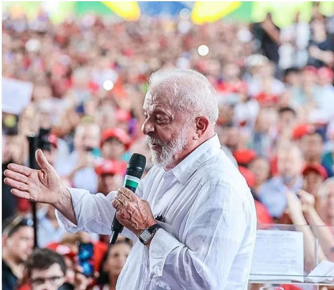
Lula da Silva: impulso às pré-campanhas dos candidatos do PL e aliados às prefeituras

O petista já tinha adiantado para parlamentares que via-