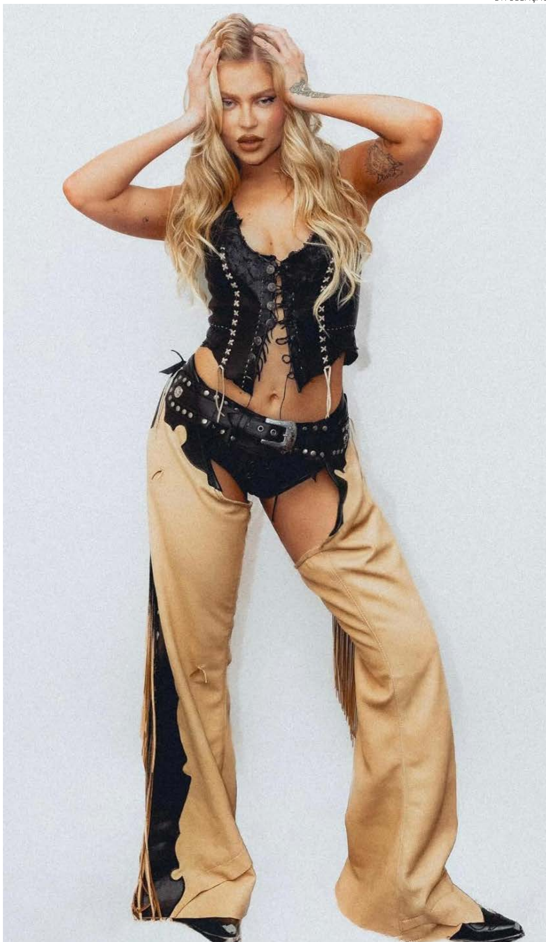
Na boca do povo: cantora esteve em evidência após sentir a bossa e provar a fossa

"O violão base está tocando bossa nova, me parece. Mas é que MPB é música popular brasileira. Meio que cobre tudo. São coisas muito diferentes. Depende mais de quem faz e qual o lugar que as pessoas veem aquele artista", analisa o tropicalista. Contudo, há razão para definir a canção feita por