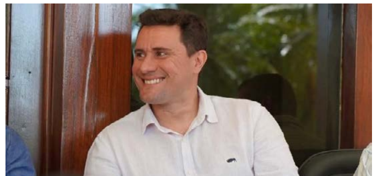
Michel Roriz: Cidadania e PSDB juntos em 2024