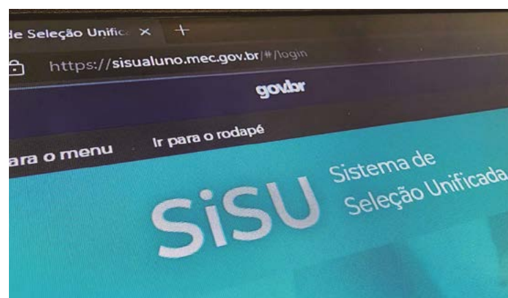
De 2010, Seleção Unificada foi desenvolvida pelo Ministério da Educação

O Sistema de Seleção Unificada (Sisu) foi instituído em 2010, e desenvolvido pelo Ministério da Educação. Se trata de um programa que reúne as vagas ofertadas pelas instituições públicas brasileiras de en-