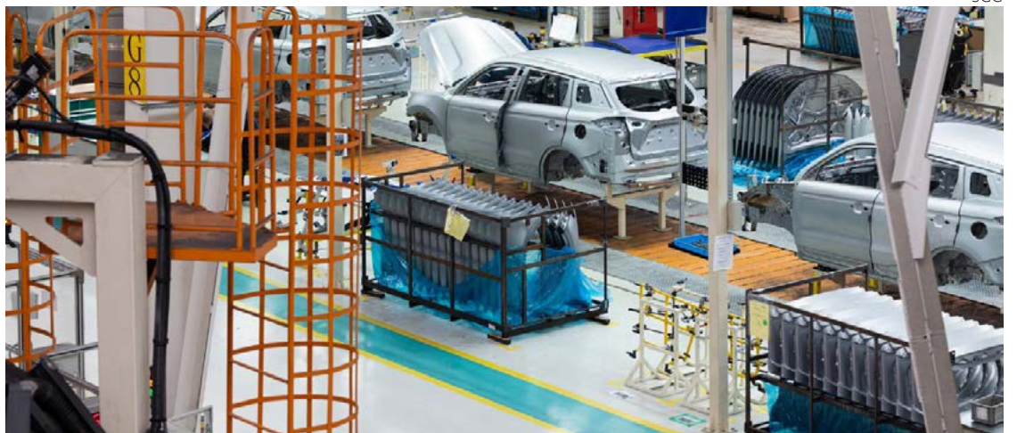
Setores de vestuário, fabricação de veículos automotores e produtos químicos puxam alta da produção industrial de Goiás

Alguns setores foram protagonistas neste momento econômico: vestuário (426%), fabricação de veículos automotores (31%) e produtos químicos (22%), respectivamente, indústria alimentícia (17,8%).