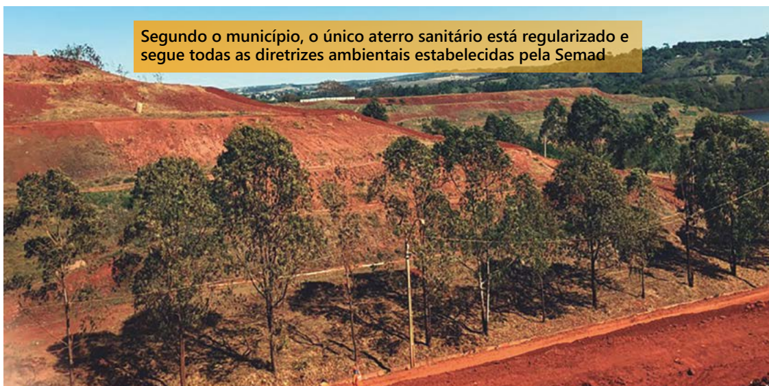
Segundo o município, o único aterro sanitário está regularizado e segue todas as diretrizes ambientais estabelecidas pela Semad

A Semad lista quatro tipos de ambientes de depósito e trata-