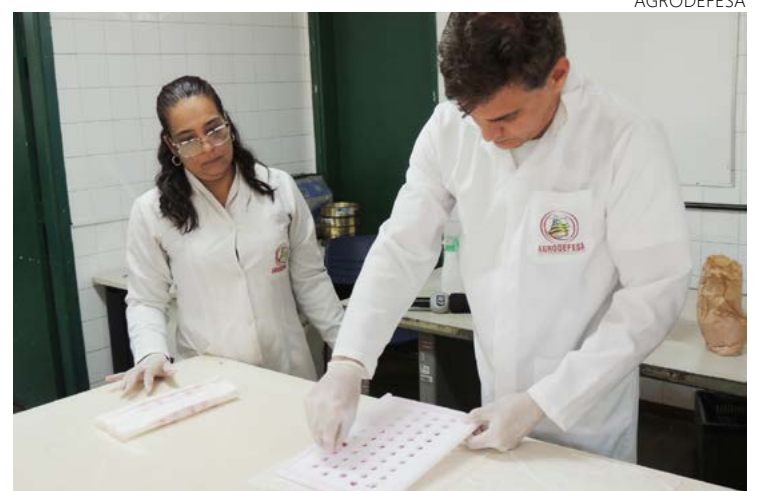
Laso/Labsem obteve 100% de aproveitamento em todos quesitos analisados

O Laboratório de Análises de Sementes (LabSem), um dos cinco laboratórios estaduais oficiais credenciados pelo Mapa, determina a identidade e a qualidade de uma amostra de sementes por meio de métodos, padrões e procedimentos estabelecidos em legislação, com a finalidade de certificação, análise fiscal e prestação de serviços, além de assegurar a identidade e a qualidade do material de multiplicação e reprodução vegetal comercializado no Estado de Goiás. Entre as espécies de sementes analisadas, destacam-se as de soja, ar-