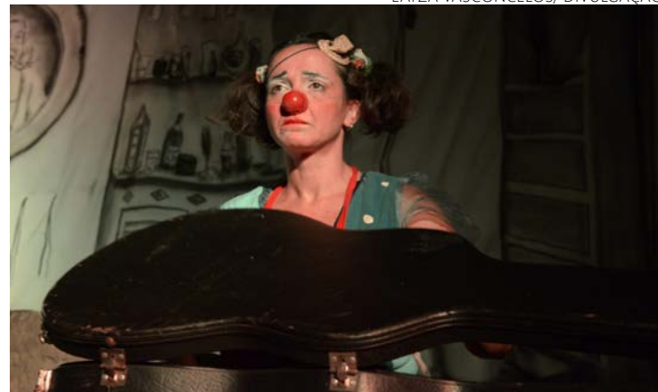
Espectáculo pauta importância estética de forma lúdica