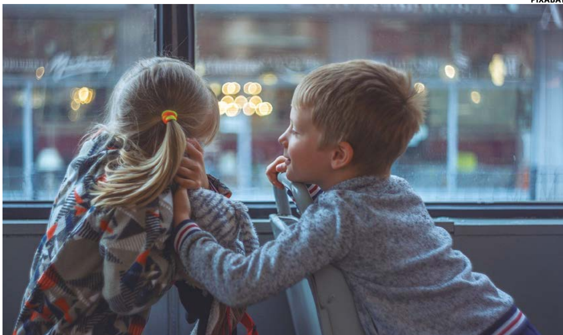
Especialista afirma que, mesmo que o menor esteja viajando com um dos pais, o outro precisa autorizar a viagem

busque a AEV com pelo menos 72 horas de antecedência. Segundo ela, o documento também pode ser importante ao dar entrada em um hotel, quando é preciso comprovar o vínculo da criança com o adulto que é responsável pela reserva.