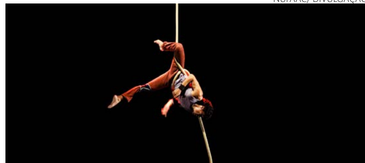
Acrobacia: curso acontecerá na sede da Cia Catavento

Na tarde desta sexta-feira, 19, a Catavento Cia Circense recebe em sua sede, em Goiânia, os dez alunos bolsistas selecionados para a quarta edição do projeto NUFAAC, Núcleo de Formação Ampliada para o Artista de Circo. Todos foram contemplados com uma bolsa de estudos e receberão formação gratuita por dez meses.